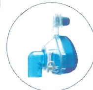
Profile™ Lite SE