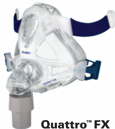
Quattro™ FX FULL FACE MASKE

Das hochmoderne Spring Air-Maskenkissen verteilt den Maskendruck gleichmäßig und verhindert unerwünschte, äußere Einflüsse. Quattro FX sitzt so sicher und komfortabel, dass Sie gut schlafen werden.